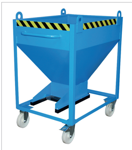
SR-D à œillets de levages