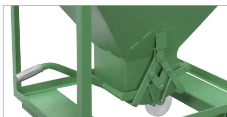
Fermeture spéciale par leviers croisés (SR, SG, SRE)