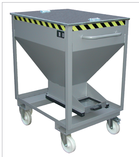
SRE-D avec couvercle